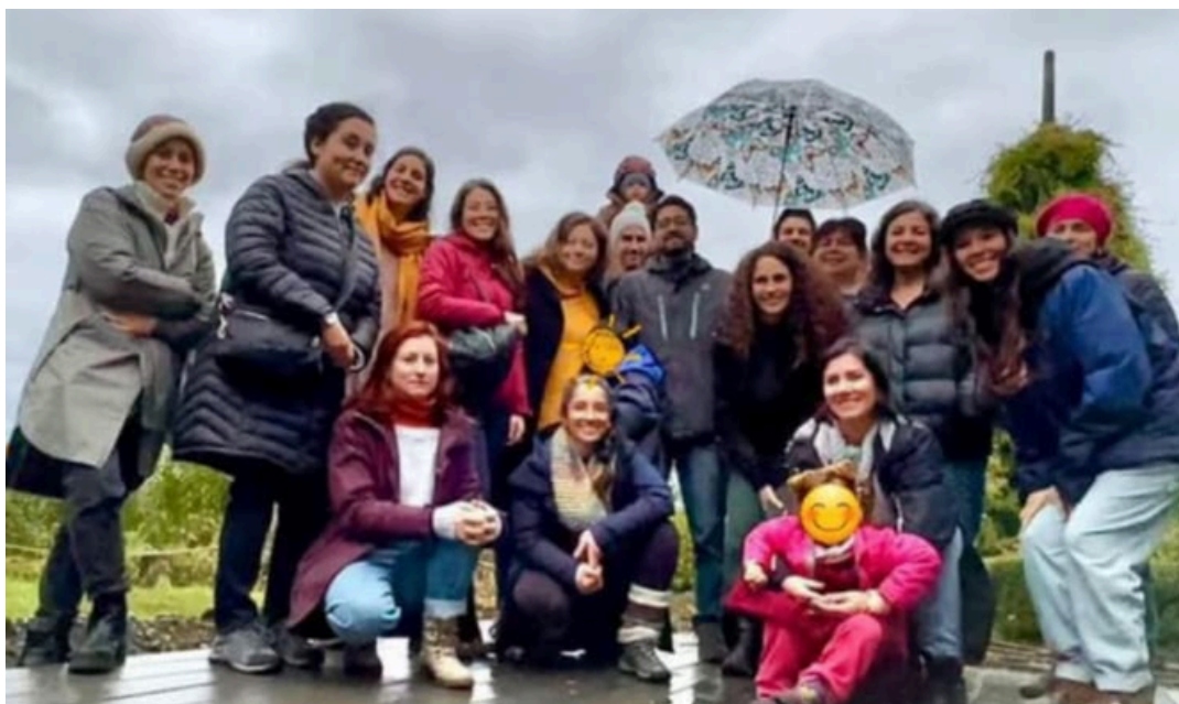
Fotografía N°2. Actividad “Biotácoras”

El formulario de inscripción registró 40 personas, mayoritariamente adultos entre 30 y 40 años, aunque también participaron personas mayores y algunos niños. Además, se logró concretar un primer encuentro presencial en julio de 2024, que permitió intercambiar experiencias y motivaciones en torno a la propuesta.